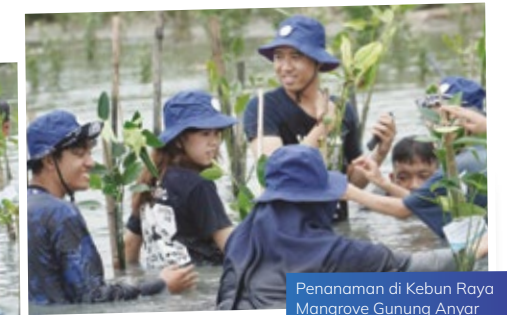
Penanaman di Kebun Raya Mangrove Gunung Anyar