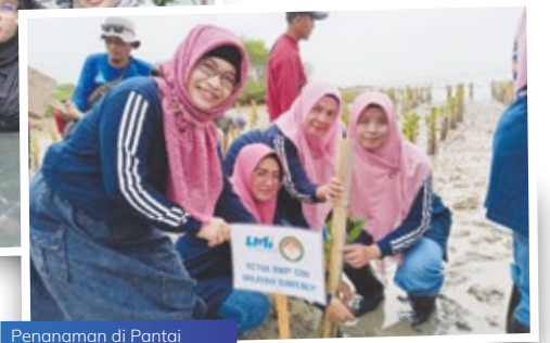
Penanaman di Pantai Kundang Wetan, Sumenep