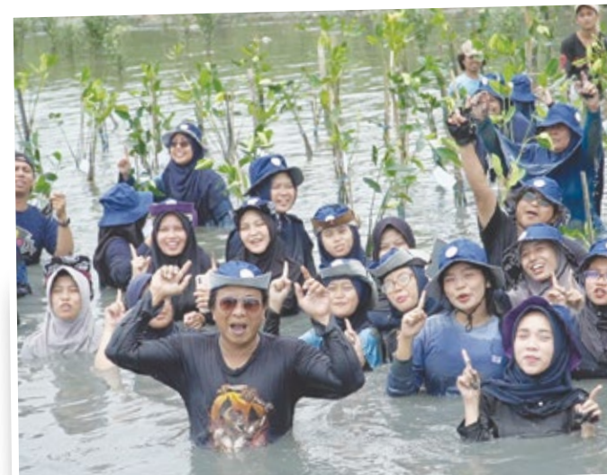
Penanaman di Kebun Raya Mangrove Gunung Anyar

Penanaman mangrove ini menjadi langkah nyata untuk memperkuat ekosistem pesisir, mengurangi dampak abrasi, serta mendukung penyerapan karbon. Lebih dari itu, kolaborasi antara lembaga, perusahaan, komunitas, dan masyarakat menunjukkan bahwa menjaga alam adalah tanggung jawab bersama demi keberlanjutan lingkungan dan masa depan generasi mendatang.